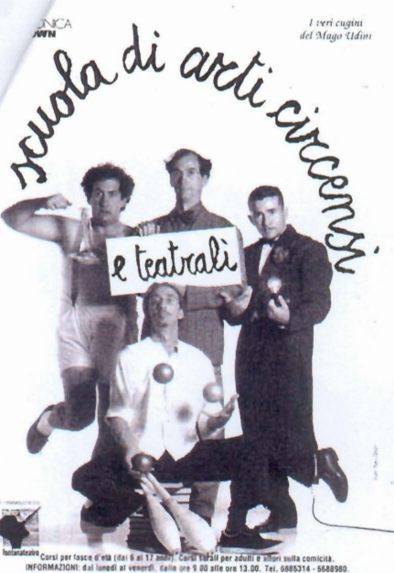
Intervista Corsi per fasce d'età (da 6 ai 17 anni). Corsi 19250 per adulti o altri sulla comicità. INFORMAZIONI: dal lunedì al venerdì, dalle ore 9.00 alle ore 13.00. Tel. 02/685314 - 6688965

che sono ormai passati alle medie continuano a frequentare in quell'Istituto la scuola di clown.